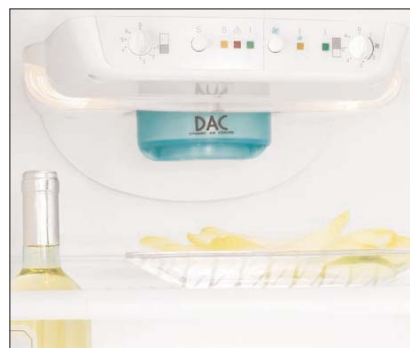
Il dispositivo DAC in dotazione al modello FI 22/10 2VA