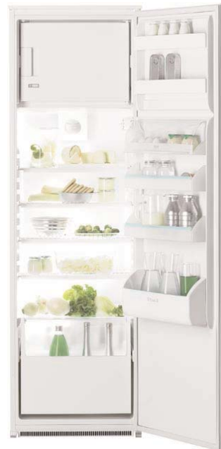
FI 325 VA Frigocongelatore DAC system Capacità totale 315 litri Frigo a sbrinamento automatico Capacità vano cantina 61 litri Capacità congelatore 35 litri Capacità di congelazione 3 kg/24 h Porta reversibile Classe energetica A