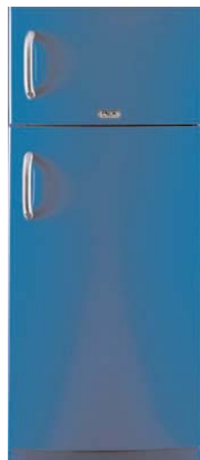
FBA 450 A