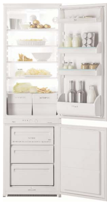
FI 22/10 2VB Frigocongelatore bimotore DAC system Capacità 290 litri Frigo a sbrinamento automatico Capacità congelatore 70 litri Capacità di congelazione 13 kg/24 h Pulsante per congelazione rapida 2 porte reversibili Classe energetica B