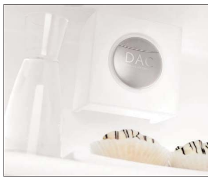
Particolare della ventola del sistema DAC