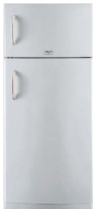
FBA 450 S