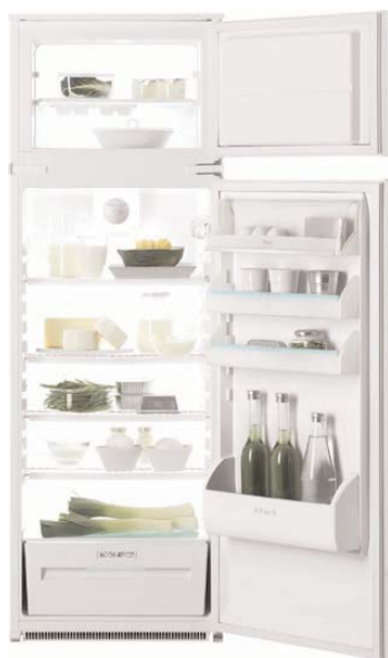
FI 295/2VA Frigocongelatore DAC System Capacità 274 litri Frigo a sbrinamento automatico Capacità congelatore 50 litri Capacità di congelazione 4 kg/24 h 2 porte reversibili Classe energetica A