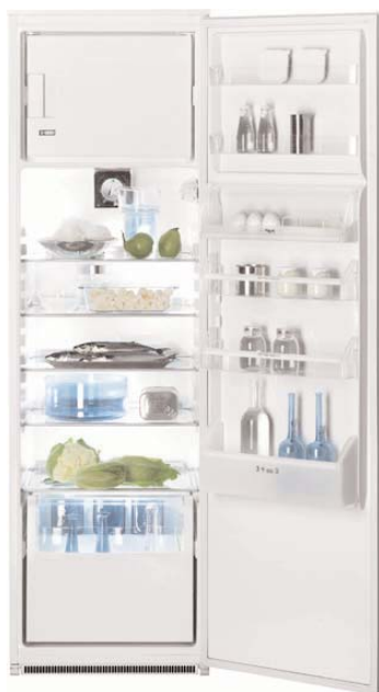
FI 325 VA+ Frigocongelatore MiniDAC Capacità totale 315 litri Frigo a sbrinamento automatico Capacità vano cantina 61 litri Capacità congelatore 35 litri Capacità di congelazione 3 kg/24 h Ripiani in vetro Porta reversibile Classe energetica A+