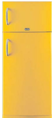
FBA 450 G