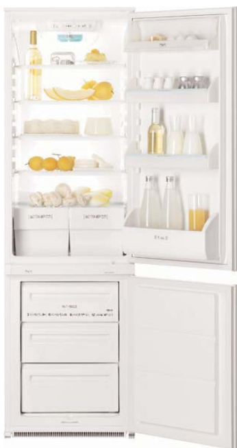
FI 22/10 2VA Frigocongelatore bimotore DAC system Capacità 290 litri Frigo a sbrinamento automatico Capacità congelatore 70 litri Capacità di congelazione 13 kg/24 h Pulsante per congelazione rapida 2 porte reversibili Classe energetica A