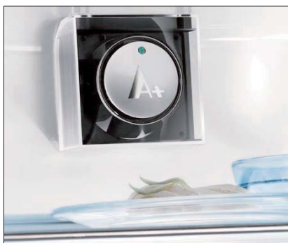
Il MiniDAC in dotazione ai modelli FI 22/10 VA+ e FI 325 VA+

Per soddisfare tutte le esigenze, il dispositivo DAC è stato adottato su numerosi modelli della gamma Rex, che si differenziano per capacità, funzionalità ed estetica. Ne sono dotati infatti sia il modello Quadrò, dalle linee squadrate e rigorose, sia i Rondò, frigocongelatori caratterizzati da forme morbide ed arrotondate; il modello monoporta con vano cantina, così come i frigocongelatori due porte, anche nella versione bimotore. Le capacità variano da 274 a 393 litri e tutti i modelli rientrano nelle classi energetiche A e A+.