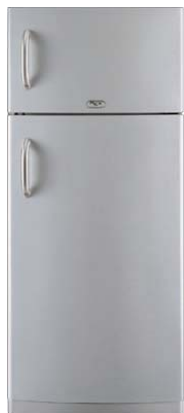
FBA 450 LS