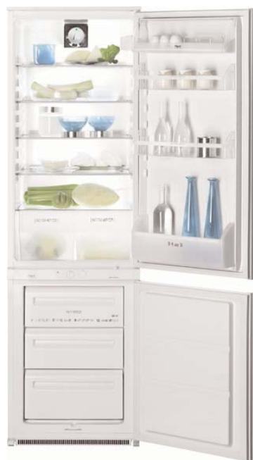
FI 22/10 VA+ Frigocongelatore MiniDAC Capacità 290 litri Frigo a sbrinamento automatico Capacità congelatore 70 litri Capacità di congelazione 4 kg/24 h Ripiani in vetro 2 porte reversibili Classe energetica A+