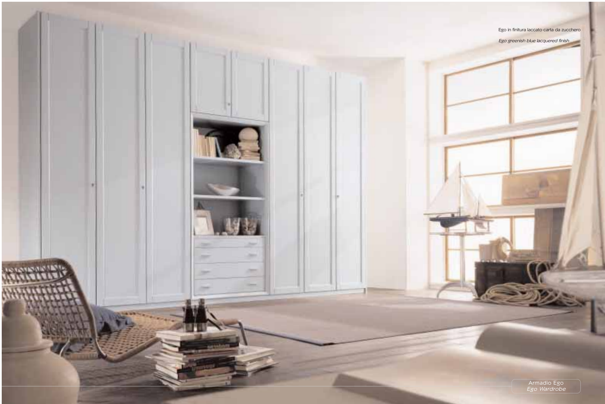
Armadio Ego Ego Wardrobe

Ego in finitura laccato carta da zucchero Ego greenish blue lacquered finish