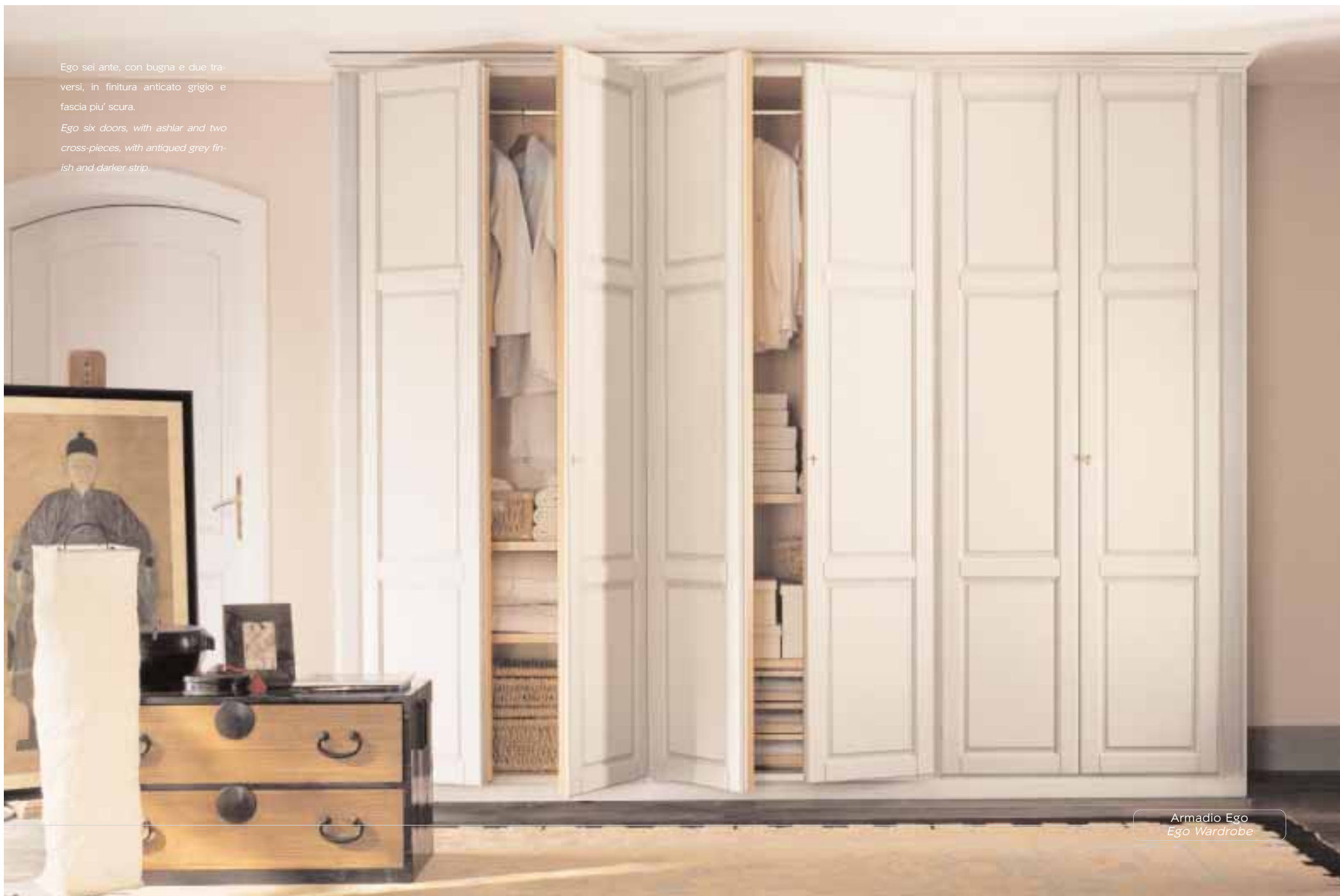
Armadio Ego Ego Wardrobe

Ego six doors, with ashlar and two cross-pieces, with antiqued grey finish and darker strip.